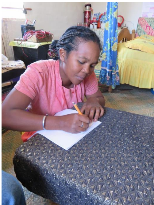
Bakoliy, entinen AFI-D- kurssilainen

Meillä oli mahdollisuus haastatella vain yhtä AFI-D-kurssin käynnyttä henkilöä Andoharano-maitsossa, koska hän asui riittävän lähellä. Muut asuvat niin kaukana, ettei heitä voinut mennä tapaamaan. Olisi tarvittu enemmän aikaa ja turvallisuussyistä meidän piti päästä lähtemään takaisin Fianarantsoaan jo iltapäivällä kun oli vielä valoisaa. Haastateltavamme osallistui koulutukseen heti hankkeen alussa vuonna 2009. Luku-, kirjoitus- ja laskutaidon lisäksi hän oppi ompelamaan. Ompelijan ammatti ei yksin riitä elämiseen, vaan tueksi tarvitaan muita tulonlähteitä kuten maanviljely ja karjanhoito. Perheen hyvinvointi on kuitenkin lisääntynyt. Hänen koulutuksessa oppimansa taidot ovat hyödyttäneet häntä, sillä ompelutöitä tehdessä hänen on osattava mitata kankaan menekki ja laskea työn kustannukset. Haastateltavamme ohjaajana toiminut opettaja tiesi kertoa, että monet muutkin oppivat lukemaan ja kirjoittamaan. Heidän elämänsä on koulutuksen ansiosta parantunut.